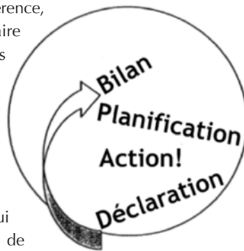
Cycle de la formation continue

En ce début de période de référence, nous vous suggérons de faire le bilan de vos compétences actuelles et vos besoins en formation afin de planifier vos activités de formation durant les deux prochaines années. Veuillez consulter la section 3 du guide sur le maintien des compétences qui porte sur la gestion du cycle de votre formation continue.