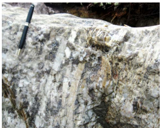
Cristaux de spodumène du gîte de Moblan, Baie-James

Le lithium est un métal mou, gris argenté et qui s'oxyde rapidement au contact de l'air. Il est le métal le plus léger du tableau périodique et, comme la plupart des métaux alcalins, il réagit facilement avec l'air et l'eau. Avant l'apparition des piles au lithium, les principales utilisations du lithium et du spodumène étaient dans les céramiques, les verres et les alliages. Le lithium est vendu sous divers produits : métal, saumure, composé (carbonate et chlorure de lithium) ou minéraux (spodumène, lépidolite et pétalite). En 2015, les principales utilisations du lithium et des minéraux de lithium étaient les piles et les batteries (35 %), les céramiques et les verres (32 %), les lubrifiants (9 %), les systèmes de traitement de l'air (5 %), les poudres de flux pour les moules de coulées de métaux (5 %), la production de polymères (4 %), la production d'aluminium de première transformation (1 %) et diverses utilisations (9 %) comme les produits pharmaceutiques (Lithium, USGS Mineral Commodity Summaries, January 2016).